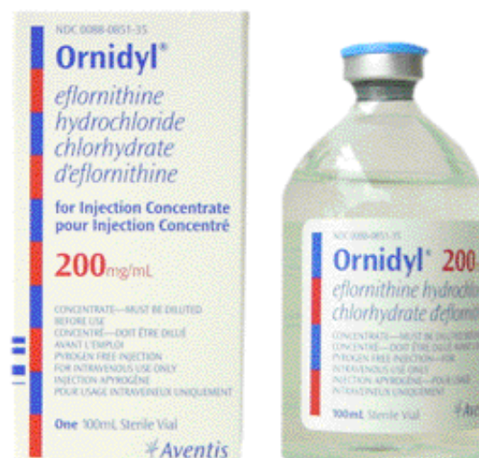
Figure 2 - Présentation du flacon Ornidyl®.

inférieures à 3750 mg/m 2 /j (3), qui fait que la voie parentérale est préférée aujourd'hui. La molécule ne se lie pas de manière